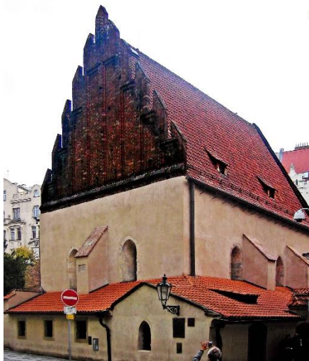
Die Altneuschul-Synagoge im jüdischen Viertel Prags.

Führung durch das Jüdische Viertel Josefov inkl. Eintritt.