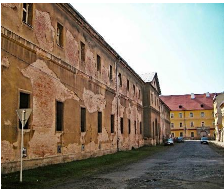
Zwischenstopp in Theresienstadt.

Ihre Reise führt in die tschechische Hauptstadt: Sie reisen mit einem