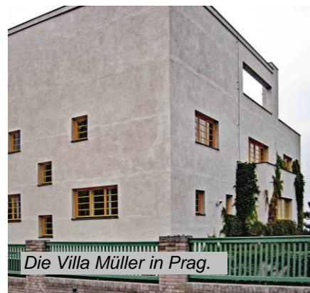
Die Villa Müller in Prag. Besuch der Prager Altstadt und des Letna-Parks.